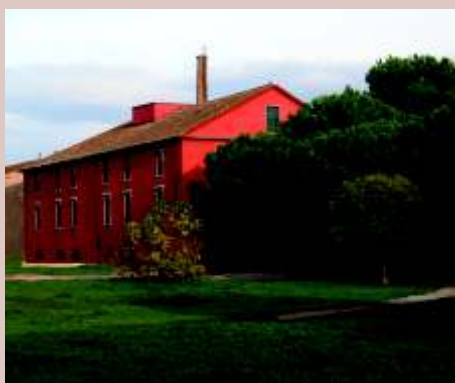
FOLLONICA Museo del Ferro e della Ghisa