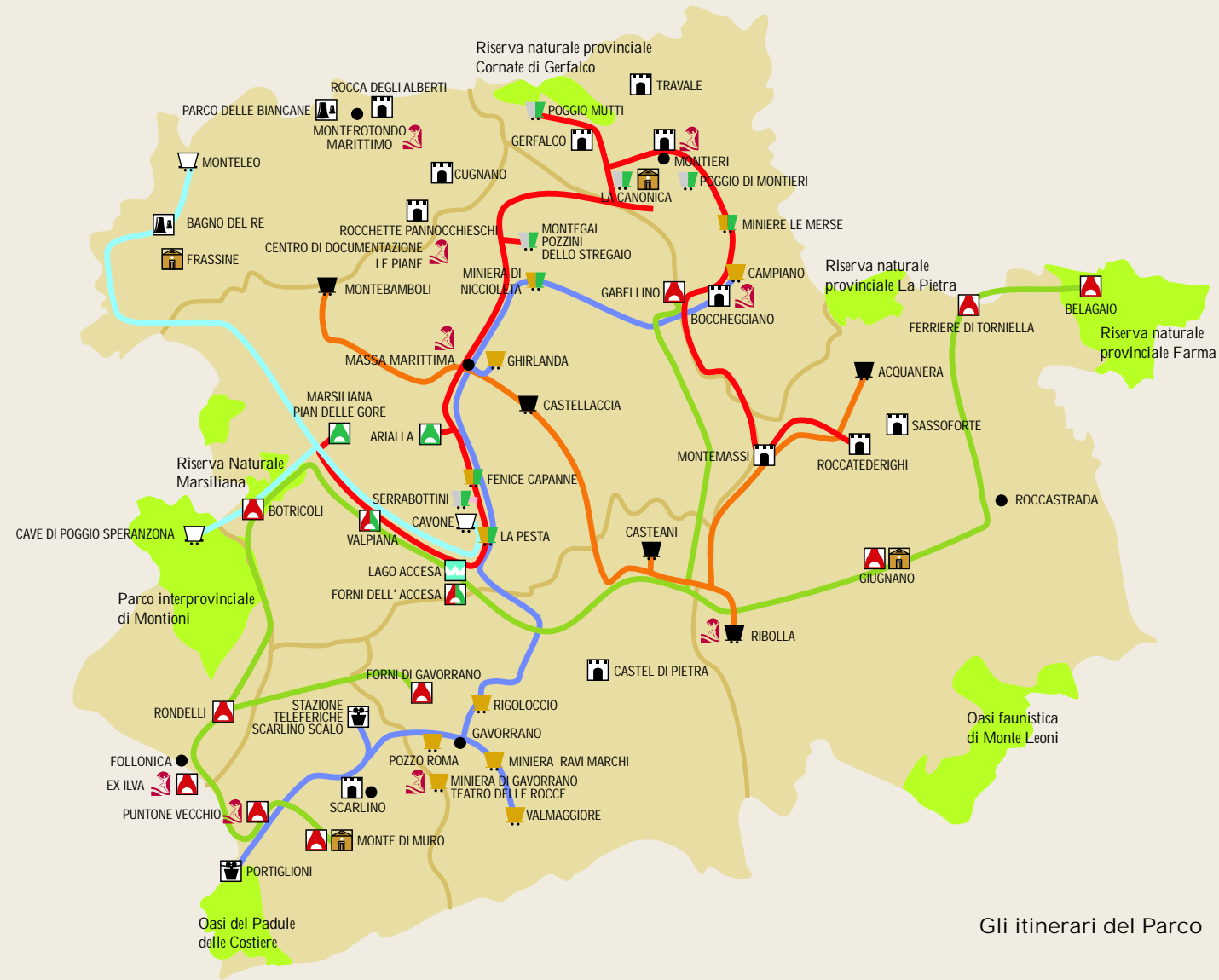
Gli itinerari del Parco