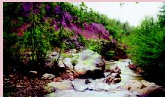
Mont IERI le roste

✉ turismo.boccheggiano@tiscali.it turismomontieri@tiscali.it