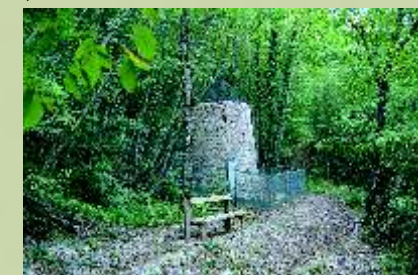
MASSA MARITTIMA Pozzo Serpieri