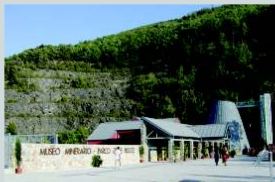
GAVORRANO ingresso Parco Minerario