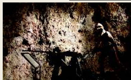
gavorrano Museo Minerario