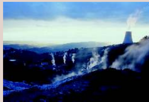
Monterotondo marittimo area geotermica

✉ parco2005@libero.it info@comune.monterotondomarittimo.gr.it