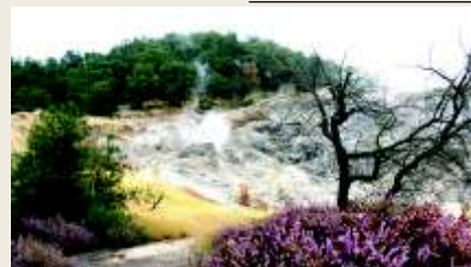
mont EROTONDO le Biancane