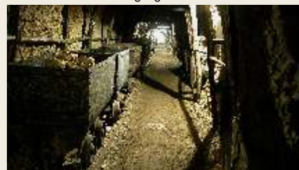
MASSA MARITTIMA Museo della Miniera

Le porte sono costituite da parchi, musei, biblioteche, centri di documentazione, teatri, punti informativi che permettono di "entrare" in uno dei più suggestivi paesaggi minerari d'Europa, unico nel suo genere frutto di tremila anni di attività per l'estrazione e la lavorazione del rame, dell'argento, del ferro, dell'allume, del carbone, della pirite e per lo sfruttamento dell'energia geotermica.