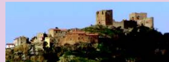
roccastrada castello di Montemassi

✉ portaparcoribolla@virgilio.it turismo@comune.roccastrada.gr.it