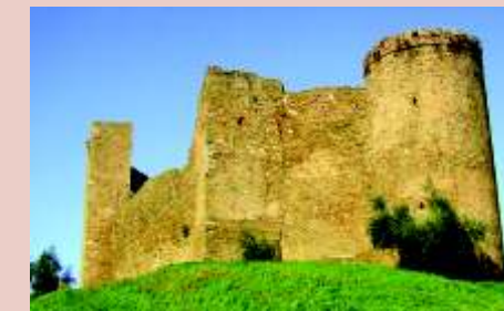
scarlino la rocca